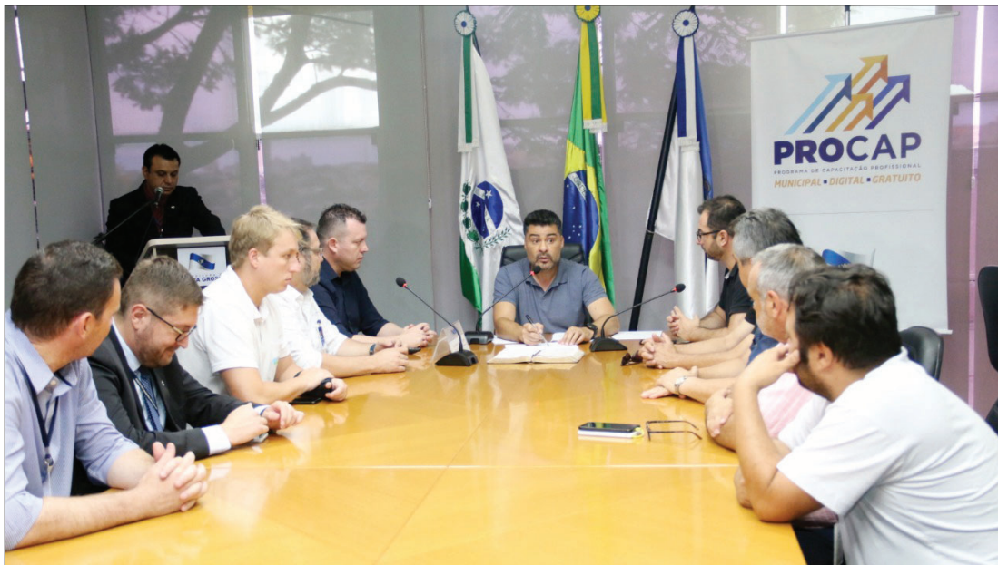
Tecnologia. Ao todo, três mil alunos serão beneficiados por aulas gratuitas fornecidas pela prefeitura