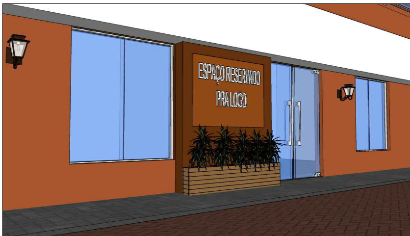
PERSPECTIVA | DETALHE TIPO FACHADA LOJAS SEM ESCALA